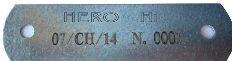
Foto della placchetta che evidenzia il n° di omologa, il nome del modello e il n° del telaio, la stessa dovrà essere fissata nella traversa posteriore B5 verso il centro del tubo stesso.