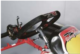
DRロゴ刺繍ステアリング