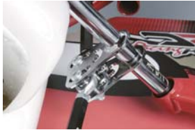
6ホールタイプ ステアリングシャフト