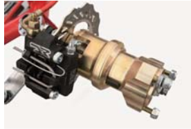
EVO (KF)フロントブレーキVEN06 マグネシウムハブ