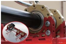
New タイプ ベアリングホルダー 標準装備