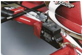
VENブレーキマスターシリンダー