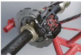
VEN05 ブレーキシステム