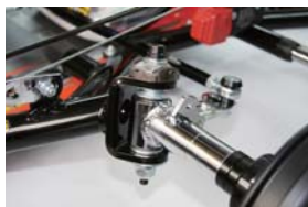
Sniper アライメントアジャスト