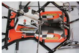
Newデザインフロアパネルステッカー