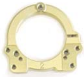
Newタイプ ベアリングホルダー