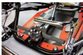
Newアジャスタブルアルミフットサポート標準装備