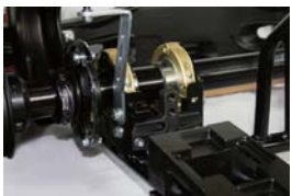
Newタイプ ベアリングホルダー