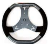
New デザイン 340 大型ステアリング 標準装備