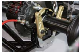
ブレーキローターガード標準装備