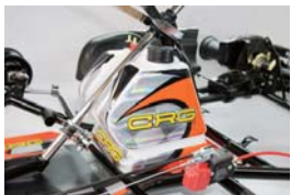
Newデザインステッカーキット