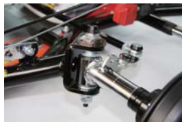
Sniper アライメントアジャスト標準装備