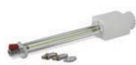
ブレーキブリーディングKIT