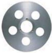
トーインゲージディスク 67mm/55 (CRG)