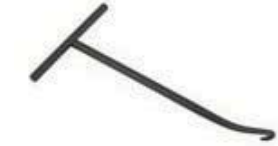
チャンバースプリングTOOL