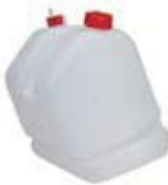
フューエルタンク 9L/リムーブ