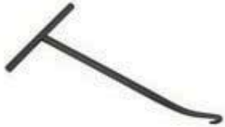
チャンバースプリングTOOL