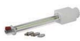
ブレーキブリーディングKIT