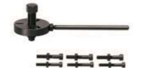
ロータープーラー OPPAMA/YAMAHA/PVL