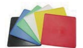
ゼッケンプレート RED/YEL/WHT/ GRN/BLU/BLK