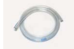
フューエルホース 6x9 1m