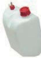
フューエルタンク Baby