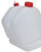
フューエルタンク 9L/リムーブ