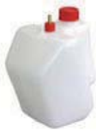
フューエルタンク 3L/Jr