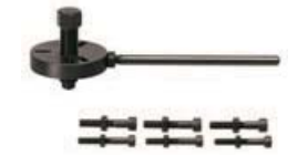
ロータープーラー OPPAMA/YAMAHA/PVL