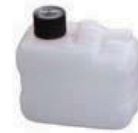
リカバリータンク